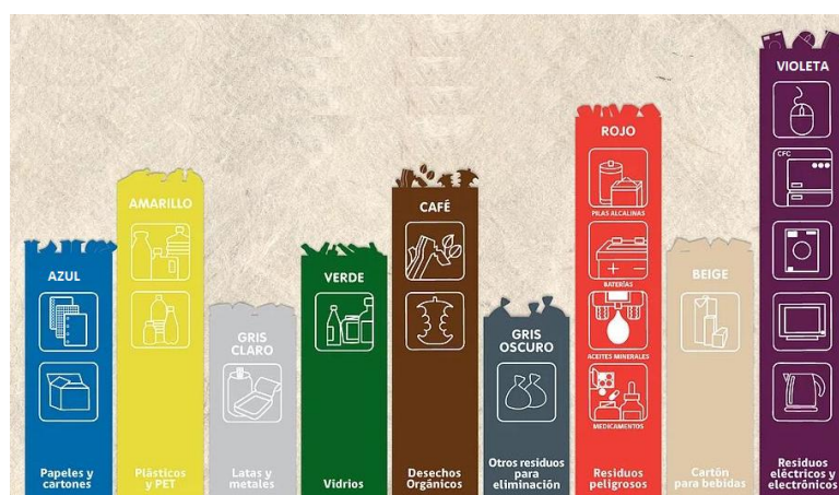
Figura 2. Norma de colores para contenedores de residuos.

En el caso de unificarse los residuos plausibles de ser reciclados en un solo contenedor, se utilizará un tono de verde distinto al especificado en la Figura 2.